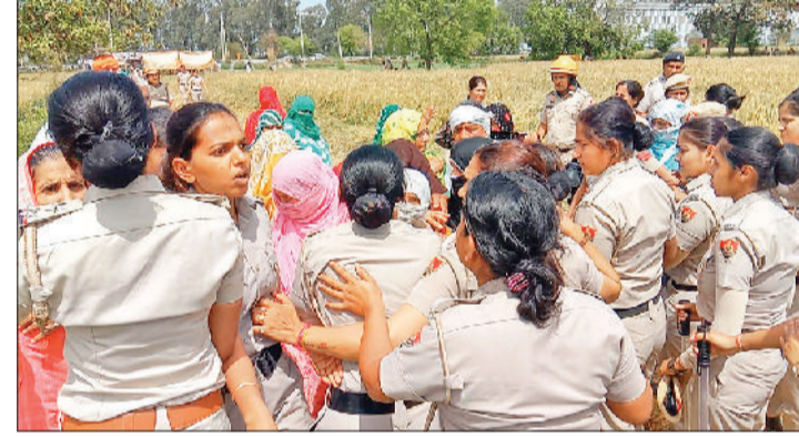
सोनीपत। महिलाओं को आगे बढ़ने से रोकती महिला पुलिस।

किसानों की कई दैर की बैठक भी हो चुकी है, लेकिन नतीजा नहीं निकला है। इस बीच रविवार को किसानों ने प्रशासन व कंपनी पर गुमराह करने का आरोप लगाते हुए पावर ग्रिड के काम को खोदे गए गड्ढों को बंद करा दिया था। नाहरा में धरनास्थल पर महिलाएं व कुछ किसान मोकै पर पहुंच गए, जिसमें संयुक्त किसान मोर्चा, भारतीय किसान यूनियन के अलावा दहिा चौबीसा व गांव नाहरा के ग्रामीणों ने भाग लिया था। फेसला लिया गया था कि मुआवजा मिलने तक काम नहीं होने दिया जाएगा। टावर