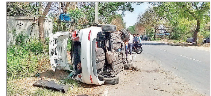
परिवार की खुशियां मातम में बदली

के साथ चचेरे भाई की शादी में शिरकत करने के लिए हरसना के पास स्थित गार्डन में आ रहे थे। उनकी कार जब