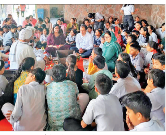
ऋषिकुल वर्ल्ड अकादमी में आयोजित कार्यक्रम के दौरान उपस्थित प्रबंधक एवं अन्य।

दी। छात्रों ने भी भाषण एवं कविता के माध्यम से अपने संकल्पों और विचारों को सभी की समक्ष रखकर सराहनीय प्रयास किया। इस अवसर पर छात्रों को पुस्तकें भी वितरित की गईं।