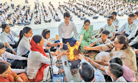
खरखौदा। यज्ञ में आहुति डालते शिक्षक व विद्यार्थी।