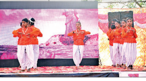
सोनीपत। कार्यक्रम के दौरान सांस्कृतिक प्रस्तुति देते कलाकार।