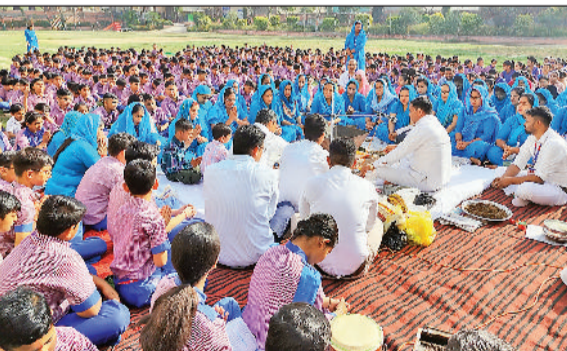
1 जी.एच.एच. 3 में-हवन में आहुतियां डालते हुए गुरु-शिष्य।

गेहूँ का सीजन शुरू हो चुका है, लेकिन सोनीपत में रोहतक रोड स्थित नई अनाज मंडी का नजारा अलग ही देखने को मिला। गेहूँ के सीजन में अनाज मंडी में अब वह किसान धान लेकर पहुंच रहे हैं, जिन्होंने सीजन के समय अपेक्षाकृत भाव न मिलने पर धान का स्टॉक कर लिया था। सोमवार को धान की आवक व खरीद हुई। सोमवार को 850 क्विंटल धान की खरीद हुई।