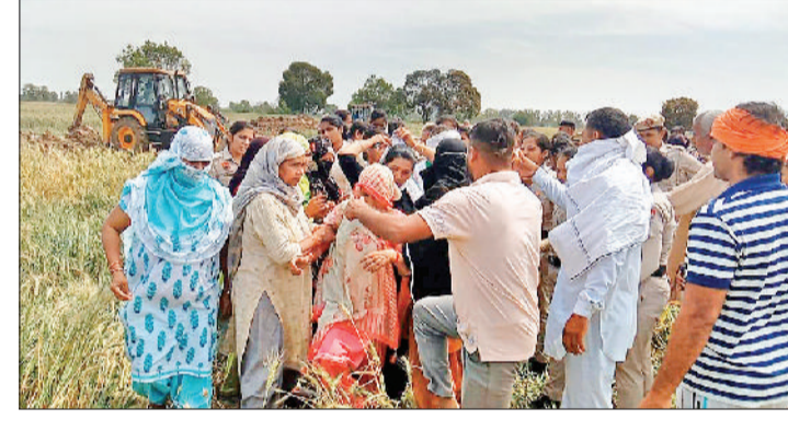
सोनीपत। निर्माण स्थल पर बुलडोजर को रुकवाने जाती महिलाएं।

लगाने के लिए अब तक खोदे गए कई गड्ढों को बुलडोजर से भर दिया था। पुलिस के साथ किसानों की झड़प भी हुई थी। सोमवार को मोकै पर भारी पुलिस बल की तैनाती में कंपनी ने फिर से गड्ढों को खोदने का काम शुरू करा दिया। जिस पर गांव की महिलाएं व कुछ किसान मोकै पर पहुंच गए और विरोध करने लगे। कुछ महिलाएं इस दौरान बुलडोजर को रुकवाने भी पहुंची लेकिन पुलिस ने उन्हें रोक दिया और मोकै पर नहीं पहुंचने दिया। इस दौरान काफी देर तक काम नहीं होने दिया जाएगा। टावर