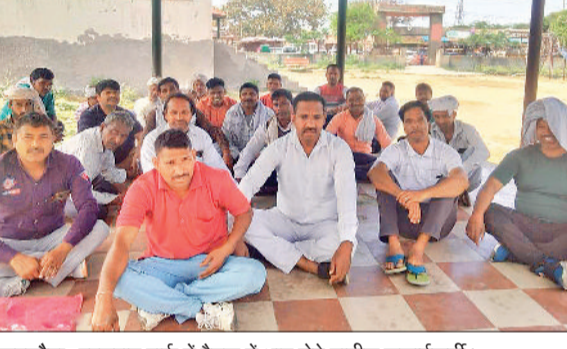
खरखौदा। परशुराम पार्क में बैठक में भाग लेते ग्रामीण सफाईकर्मी।