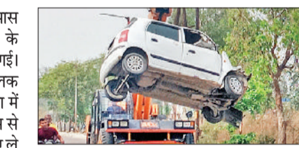
पहुंचे और क्षतिग्रस्त कार को हाईड्रा की मदद से थाने में लेकर आए। प्राप्त जानकारी के अनुसार